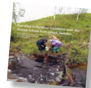
Naturskolans skrift om utomhuspedagogik på engelska

Läroplan för grundskolan, förskoleklassen och fritidshemmet